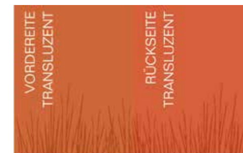
Mandarine (Exklusiv bei METTEN)