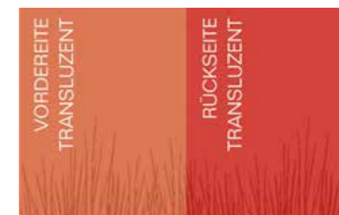
Mango (Exklusiv bei METTEN)