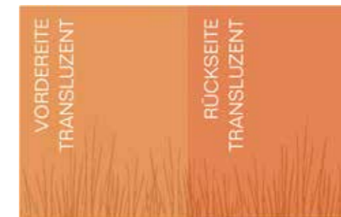
Marilla (Exklusiv bei METTEN)