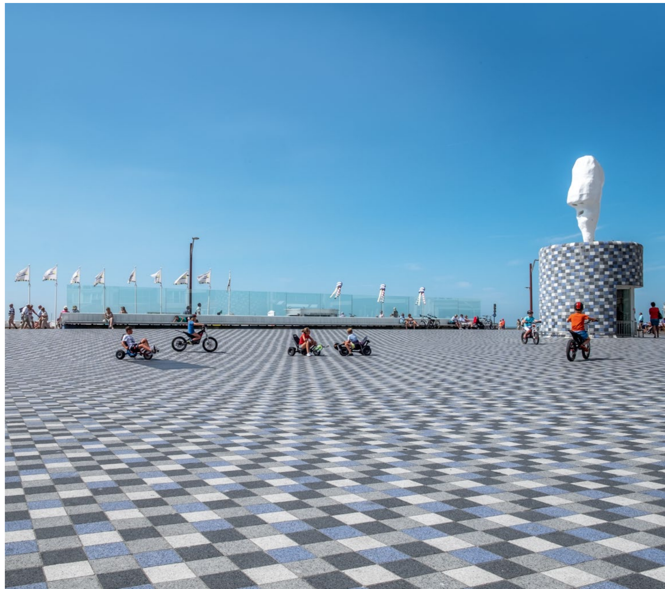
Die Zugänge zur Tiefgarage befinden sich in den beiden Pavillons, die mit demselben Boulevard-Material verkleidet wurden.

Die leicht konkave Bodenfläche ist mit Betonsteinen in den Farben Grau, Weiß und Blau gepflastert, die ebenso wie das Verlegemuster der Nordsee nachempfunden sind. Wir entschieden uns für ein Ornamentpflaster aus geschliffenem Betonstein von METTEN, weil diese sich durch ihre Langlebigkeit auszeichnen und die Farben, die man uns auf unsere Bitte hin entwickelte, genau unseren Vorstellungen entsprachen. Außerdem lieferte METTEN die Einfassungen auf der Meeresseite des Platzes, die farblich auf das übrige Pflaster abgestimmt wurden. Diese halten den Platz frei von Sand. Die Verkleidung der beiden Pavillons auf dem Platz ist aus dem selben Pflastermaterial. In den Pavillons befinden sich die Zugänge zur Tiefgarage. Sämtliche Materialien wurden nach unserem Entwurf für den Platz maßgefertigt und unterstreichen unsere Vision. Auf den Pavillons wurden Skulpturen von Franz West aufgestellt, zwei riesige Köpfe mit einer Höhe von fünf Metern. West nannte sie „Lemurenköpfe“ und verwies damit auf die Totengeister der alten Römer. Sie sind aus nachhaltigem Kunststoff gefertigt.“