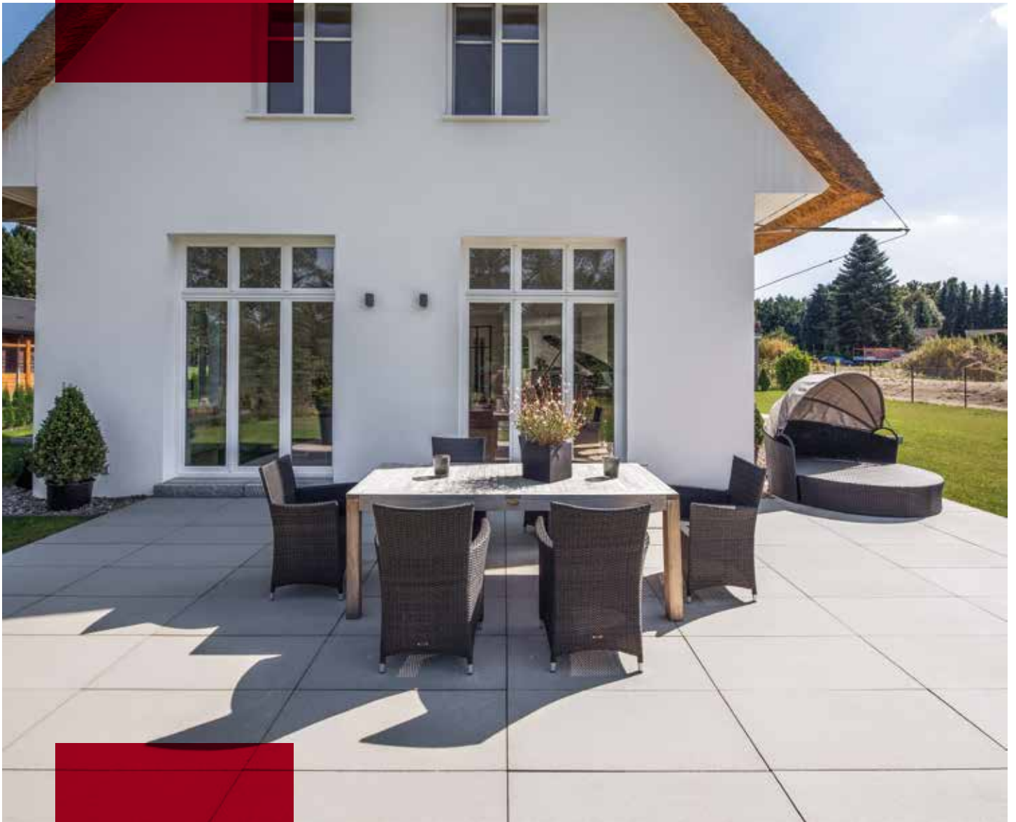
Privatobjekt in Hanstedt